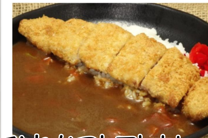
ひれかつトマトカレー